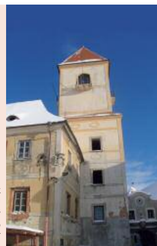
Now the walls of the ancient building are still decorated with Coudenhove-Kalergi's coats of arms