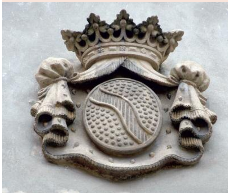
Сегодня стены древнего здания по-прежнему украшает герб Куденхове-Калерги